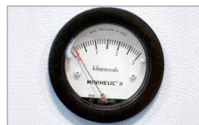
Indicateur de pression différentielle pour contrôle des filtres