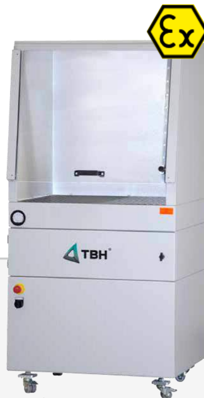
Similaire à l'image

La DT150 a été spécialement conçue selon les principes ATEX et est compatible pour les zones 22 (poussières) et 2 (gaz).*